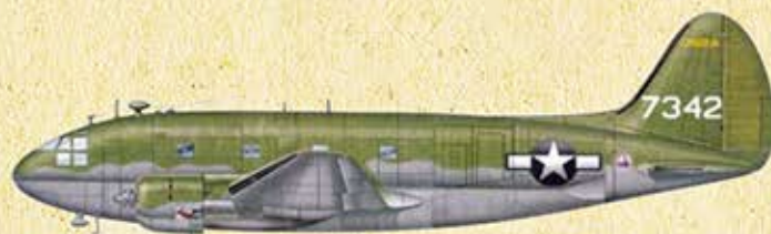
Curtiss C-46 Commando.